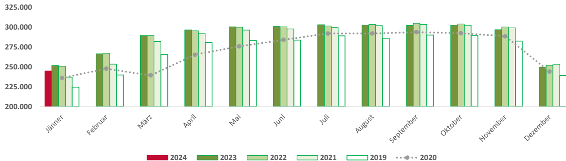
Abbildung 2: Unselbstständig Beschäftigte im Bau, Jänner 2019 bis Jänner 2024