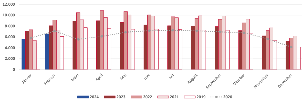
Abbildung 4: Sofort verfügbare offene Stellen im Bau, Jänner 2019 bis Februar 2024

Im Baubereich zeigte sich, wie auch gesamtwirtschaftlich, seit Anfang 2021 ein starker Zuwachs an beim AMS gemeldeten offenen Stellen. Die Anzahl der sofort verfügbaren offenen Stellen lag sogar seit Oktober 2020 fast kontinuierlich über dem Vorkrisenniveau, allerdings zeigen sich seit August 2022 Rückgänge im Vergleich zu den Vergleichsmonaten der Vorjahre (Abbildung 4).